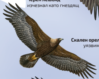
Скален орел уязвим