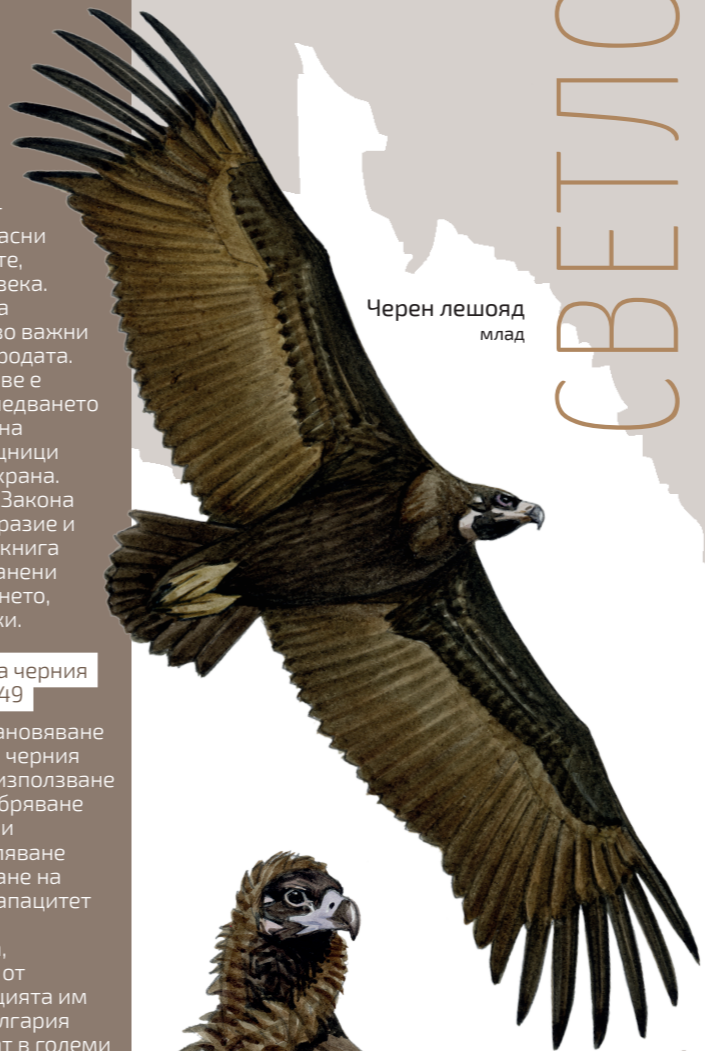
Черен лешояд млад

За да постигнем това, внасяме черни лешояди от Испания, където популацията им е най-многобройна. В България лешоядите се настаняват в големи клетки за адаптация, за да свикнат с условията, климата и района, за да възприемат района като свой дом. След няколко месеца престой, пускаме птиците на свобода, с надеждата те да заселят районите, които сме избрали за тях след години проучвания и предварителна работа. Всички освободени птици са маркирани с индивидуални жълти крилни марки, жълти пръстени и специални сателитни предаватели, за да следим тяхното движение и адаптация на свобода. Станете част от завръщането на лешоядите в България, научете повече на: www.greenbalkans.org/VulturesBack