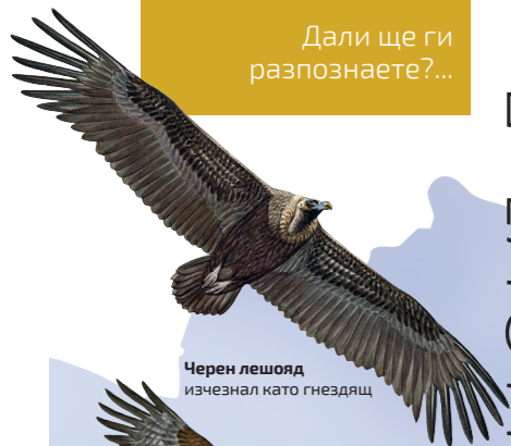
Черен лешояд изчезнал като гнездящ