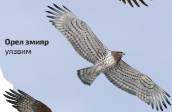
Орел змияр уязвим